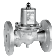
水道法基準適合品