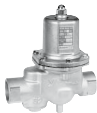
水道法基準適合品