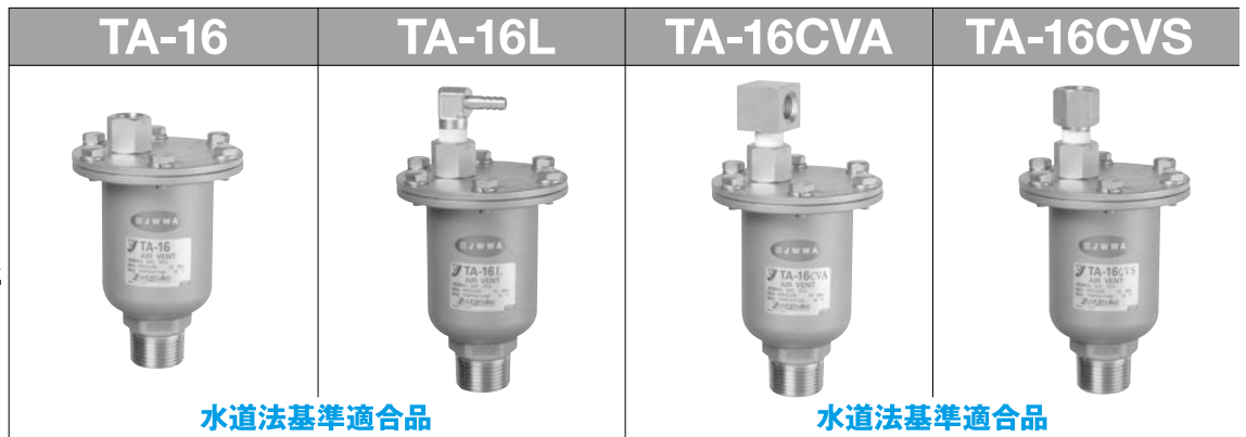
水道法基準適合品